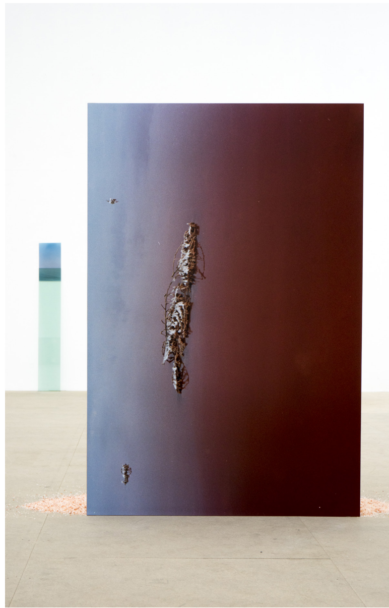
Perrine Géliot, L'envers et l'endroit , 2020. Chêne massif, tirage chromogène sur dibond, 150cm x 100cm x 30cm